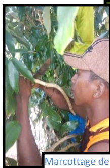
Marcottage de litchis