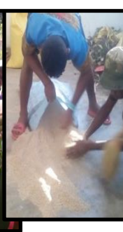
Fabrication de provende