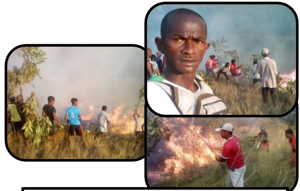
ELEVES ET FORMATEURS ETEIGNANT DU FEU DE BROUSSE FAIT PAR UN INCONNU

Nous y avons appris beaucoup de choses Dans le domaine de l'éducation nous apprenons à se communiquer avec les autres à les respecter, l'environnement et les biens communs