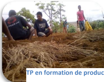
TP en formation de production végétale