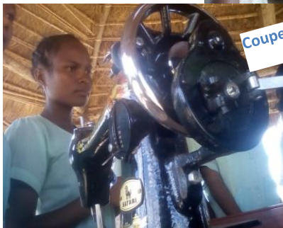
Coupe et couture

Avant nous ne faisons pas d'autres activités extrascolaires comme la fabrication du gâteau Au collège nous pratiquons plus