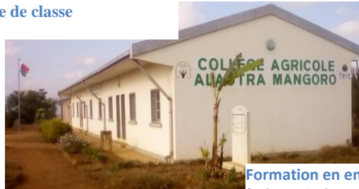
Salle de classe