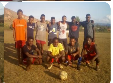
Les footballeurs de la 1 o année

de sports : football basketball pétanque danse de la coupe et couture de fabrication de gâteau..