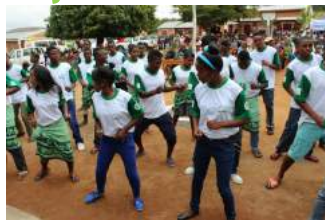
Danse folklorique préparée par les élèves