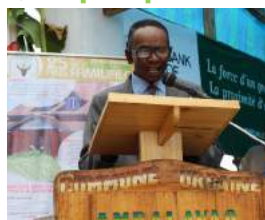
Discours d'ouverture du président du Comité paysan