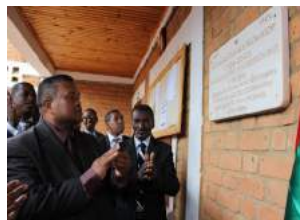
Inauguration de la plaque commémorative