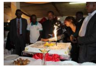
Cérémonie du gâteau d'anniversaire