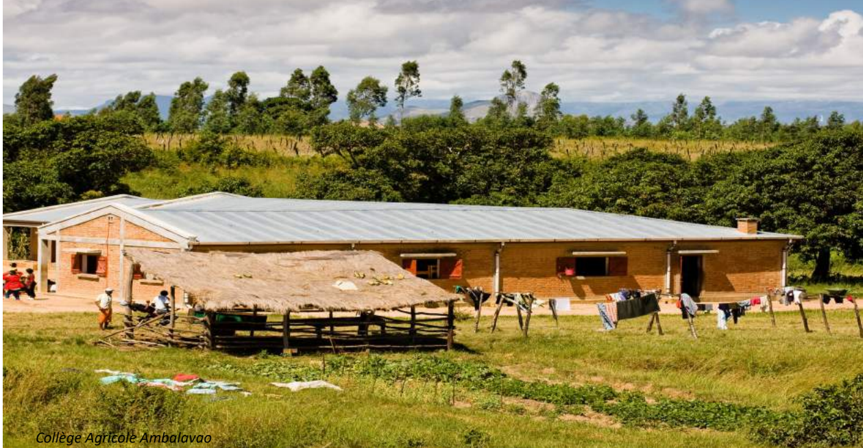
Collège Agricole Ambalavao